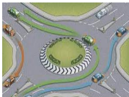
DOK CZV PRG 01